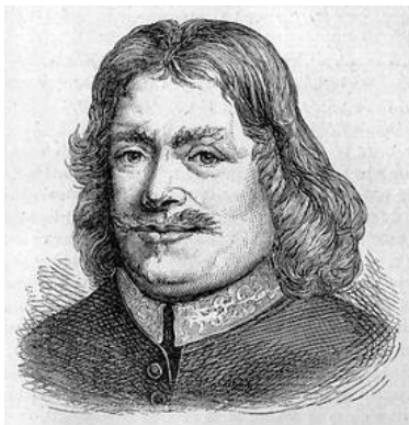
John Bunyan

In het jaar 1645 was er een jongen in het leger die op enig moment met een kameraad zijn post ruilde, zodat die voor hem als schildwacht kon staan. Diezelfde nacht kreeg die plaatsvervanger een kogel in het hoofd en stierf. Dit feit maakte diepe indruk op zijn makker, John Bunyan.